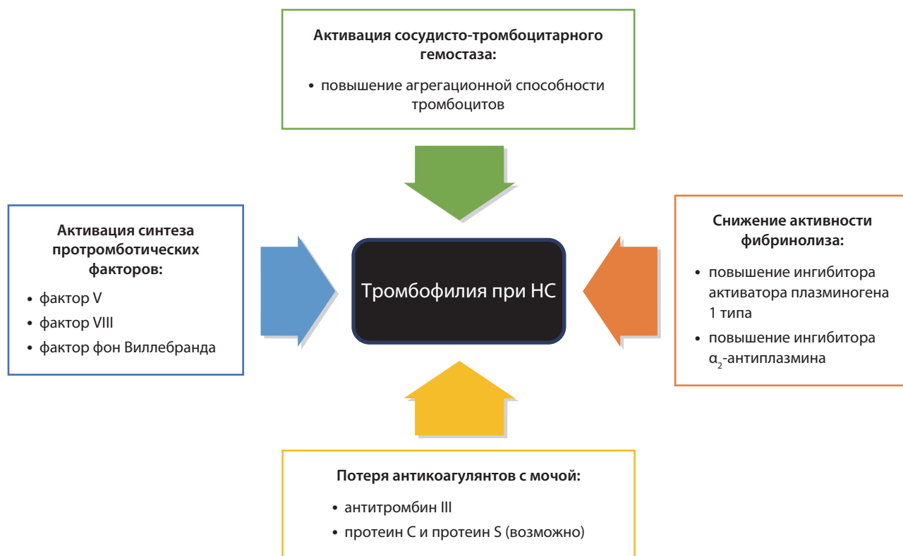
Рис. 1. Потенциальные механизмы развития тромбофилии при НС

Потенциальные механизмы развития тромбофилии при НС связаны с комплексным взаимодействием наследственных и приобретенных факторов риска, хроническим воспалением на фоне гломерулонефрита, развитием дисбаланса между анти- и прокоагулянтными белками, наряду со снижением фибринолитической активности [1, 8, 12, 36, 55] (рис. 1). НС сопровождается потерей антикоагулянтных белков с мочой [1, 8]: дефицит антитромбина III наблюдается у 40-80% пациентов [56], снижение уровня плазминогена, протеинов С и S встречается реже [55]. На этом фоне происходит усиление синтеза в печени протромботических белков (факторы V и VIII, фактор фон Виллебранда, фибриноген, \alpha_2 -макроглобулин) на фоне активации продукции белков острой фазы воспаления. Считается, что гипоальбуминемия в ответ на сохраняющуюся протеинурию стимулирует синтез прокоагулянтов и фибриногена в печени, что способствует