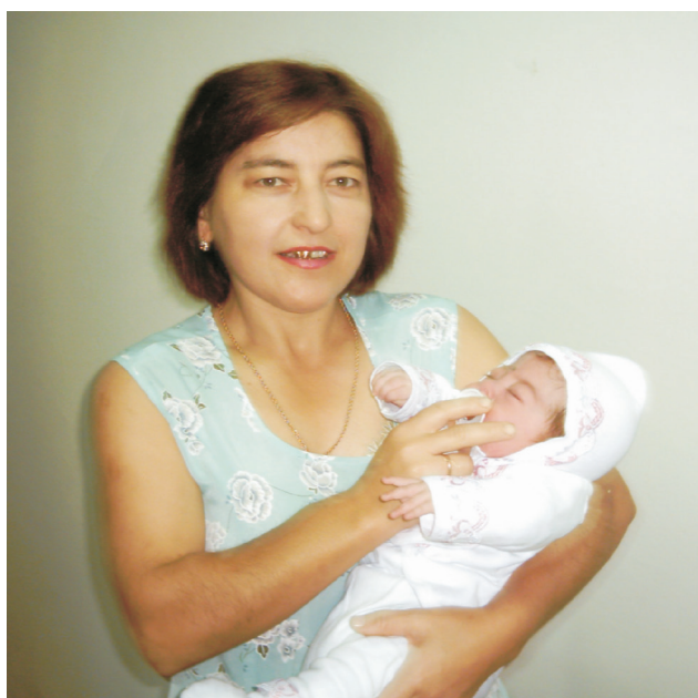
Рис. 2. Больная III с дочерью