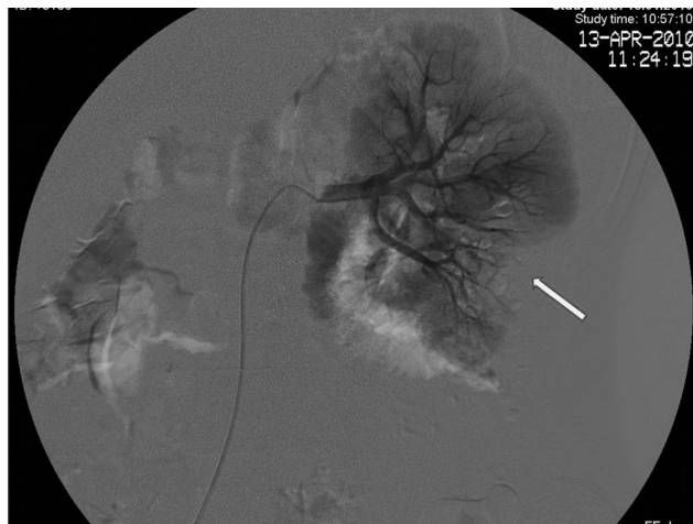
Рис. 3. Селективная ангиография сосудов почек