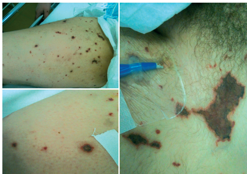
Рис. 1-3. Геморрагически-некротические высыпания на коже больного X, 16 лет

При ультразвуковом исследовании органы брюшной полости — без явных патологических изменений. Почки — паренхима без выраженных изменений, размеры не увеличены, кровоток не оценен из-за технических сложностей. Эхо-кардиография: полости сердца не расширены, фракция выброса 60%, недостаточность митрального и трикуспидального клапанов.